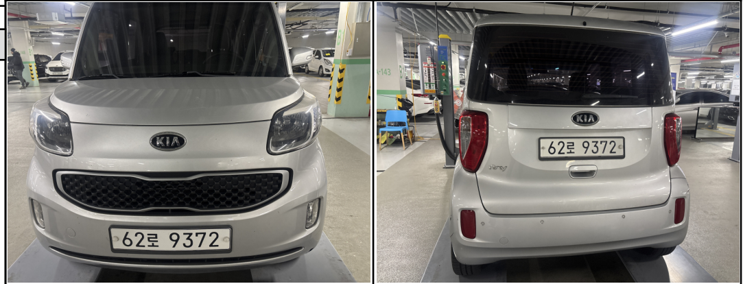
점검 장면 촬영 사진 [6517104673]

※ “가격조사·산정”은 소비자가 매매계약을 체결함에 있어 중고차 가격의 적절성 판단에 참고할 수 있도록 법령에 의한 절차와 기준에 따라 전문 가격조사·산정인이 객관적으로 제시한 가액입니다. 따라서 “가격조사·산정”은 소비자의 자율적 선택에 따른 서비스이며, 가격조사·산정 결과는 중고차 가격판단에 관하여 법적 구속력은 없고 소비자의 구매여부 결정에 참고 자료로 활용됩니다.