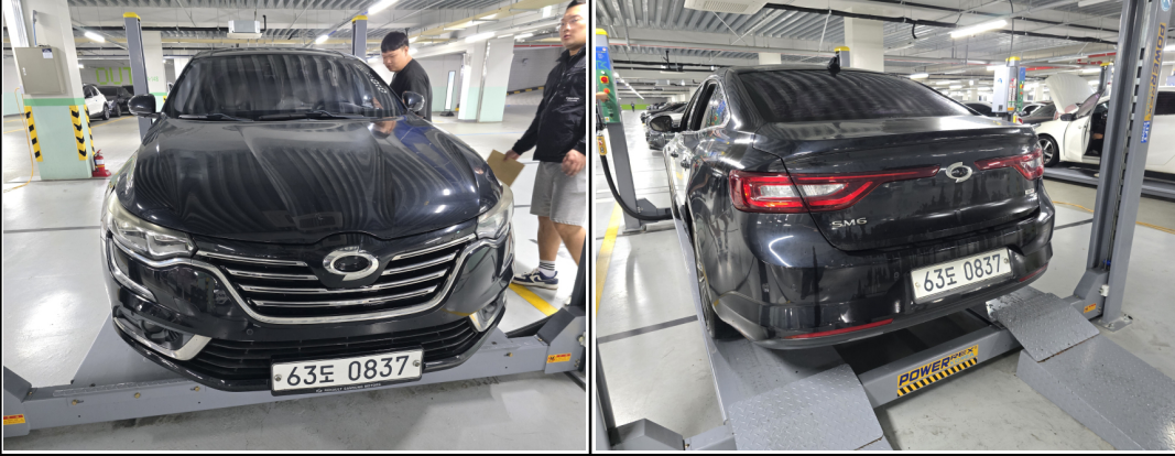
점검 장면 촬영 사진 [6517101341]

※ 「가격조사·산정」은 소비자가 매매계약을 체결함에 있어 중고차 가격의 적절성 판단에 참고할 수 있도록 법령에 의한 절차와 기준에 따라 전문 가격조사·산정인이 객관적으로 제시한 가액입니다. 따라서 “가격조사·산정”은 소비자의 자율적 선택에 따른 서비스이며, 가격조사·산정 결과는 중고차 가격판단에 관하여 법적 구속력은 없고 소비자의 구매여부 결정에 참고 자료로 활용됩니다.