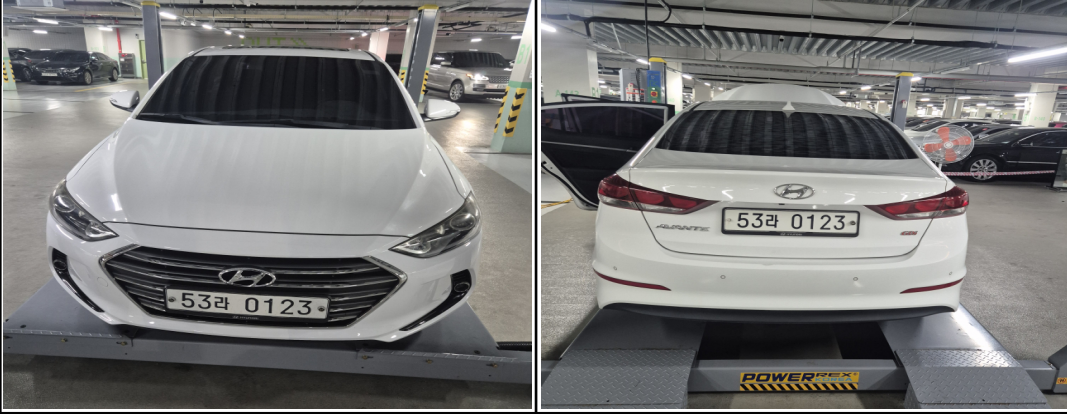
점검 장면 촬영 사진 [6517101196]

※ "가격조사·산정"은 소비자가 매매계약을 체결함에 있어 중고차 가격의 적절성 판단에 참고할 수 있도록 법령에 의한 절차와 기준에 따라 전문 가격조사·산정인이 객관적으로 제시한 가액입니다. 따라서 "가격조사·산정"은 소비자의 자율적 선택에 따른 서비스이며, 가격조사·산정 결과는 중고차 가격판단에 관하여 법적 구속력은 없고 소비자의 구매여부 결정에 참고 자료로 활용됩니다.